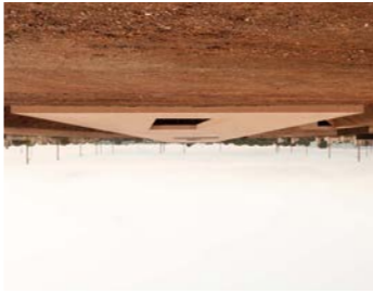
Rudy Ricciotti 2006-2015 Rivesaltes, Pyrénées Orientales

La jungle de Calais est démantelée par les autorités françaises, alors que mille kilomètres plus au sud, celles-ci inaugurent le mémorial du camp de Rivesaltes. Des réfugiés espagnols fuyant la guerre civile jusqu'à l'internement des haris en passant par celui des juifs et des algériens, le camp cristallise tous les drames du XXe siècle. Au milieu des ruines d'un monde terrifiant, le grand parallélépipède semi-enterré imaginé par Rudy Ricciotti évoque avec force le poids de l'histoire.