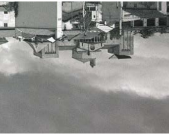
Lluís M. Vidal Arderiu 1990 Catedral de la Seu d'Urgell La Seu d'Urgell, Lleida

Le clocher qui avait été ajouté aux tours de la cathédrale de la Seu d'Urgell a été démonté au début du Xxe siècle pour récupérer la symétrie qu'offrait le bâtiment à son origine. Les cloches ont été déplacées sur la toiture d'une des tours, sous le niveau de la corniche ce qui a eu pour effet de les rendre inaudibles. L'intervention consiste en un mécanisme sur pistons activé en cas de besoin, sorte de grande bouche qui s'ouvre pour parler et se ferme pour se taire.