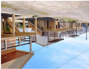
Pian Fagard Dès 1949 Gruissan, Aude

Le Club Med naît en 1950 avec son ambiance nature et palliottes tandis que 43% des français se logent encore chez des parents pour les vacances. Depuis 1945, le tourisme est le premier secteur de développement économique en France. Quand il pousse la côte espagnole à se couvrir de maisons individuelles, la Grande Motte est conçue comme une ville dotée de rues et de places, d'infrastructures communes, de logements et de commerces.