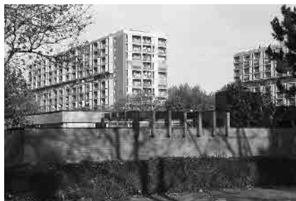
58 Schwabgut, 1962–69