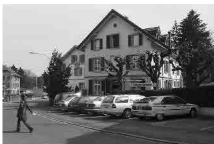
73 Restaurant «Stöckacker»