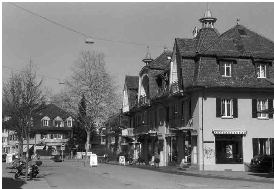
14 Bümplizstrasse, Wohngeschäftshaus von 1905