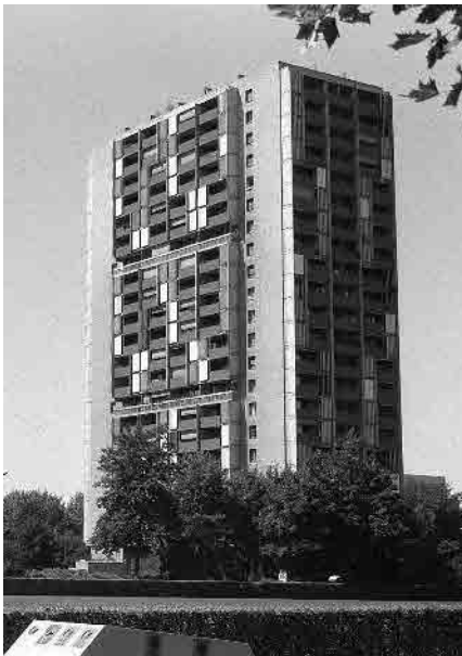
57 Schwabgut, Punkthochhaus