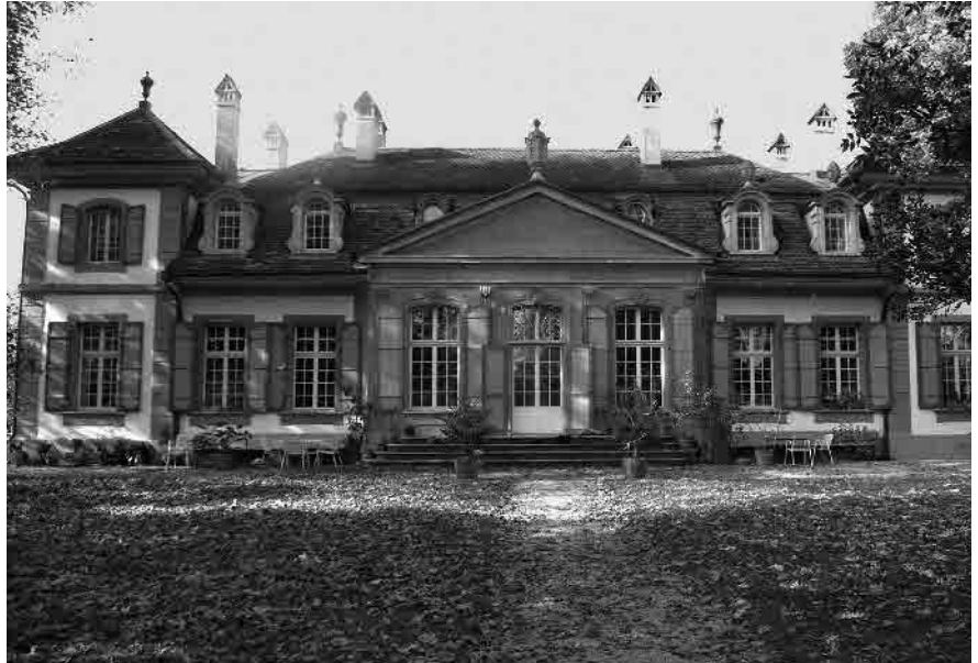
23 Neues Schloss, 1742, Gartenfront