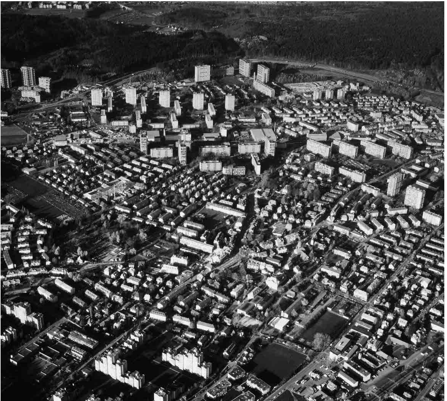
Flugbild 1987

Arbeiter- und Angestelltenvorort Berns, ehemals selbständige Bauerngemeinde. Dörflicher Kern umgeben von Wohnquartieren des 20. Jahrhunderts. Um 1955–1980 Ausbau zur grössten Satellitenstadt der Deutschschweiz, mit mehreren Highlights des damaligen Grosswohnungsbaus.