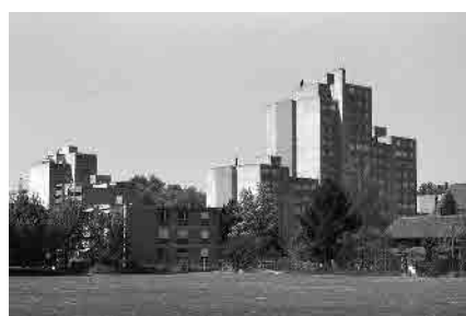
33 Überbauung Kleefeld, 1968–72