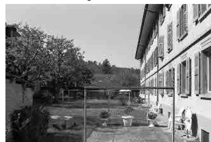
31 Wohnkolonie Weidmatt, 1925