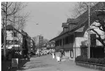
12 Beim «Sternen»