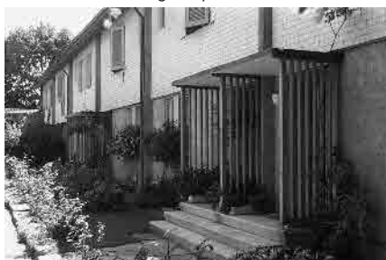
53 Wintermattweg, 1953