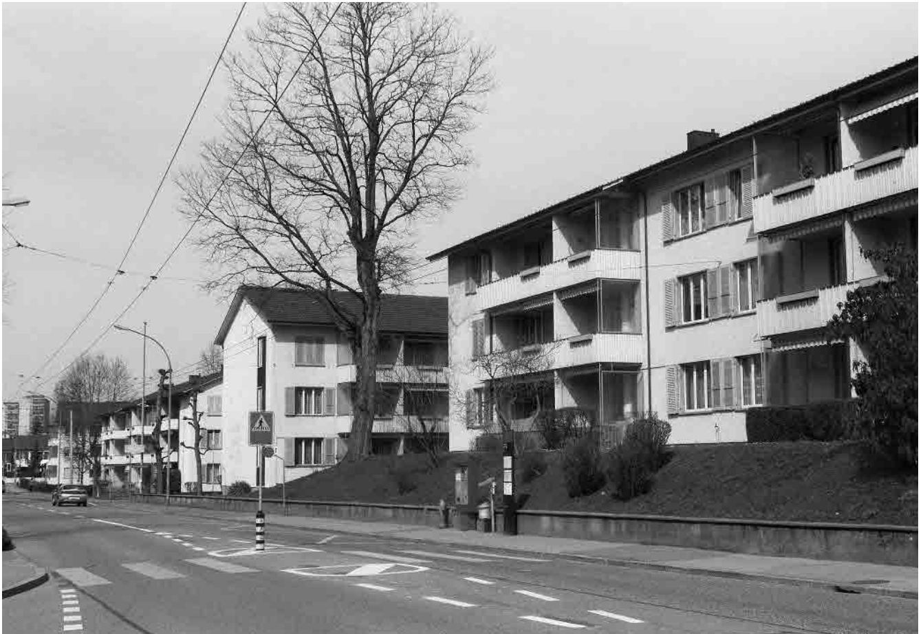
68 Genossenschaftssiedlung Meienegg, 1949–55