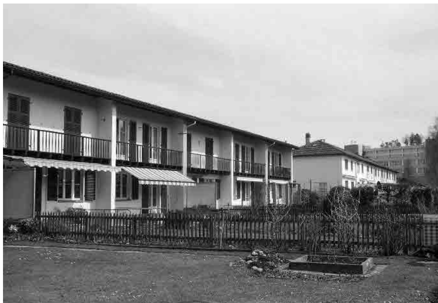
62 Genossenschaftssiedlung Burgunderstrasse, 1934–43