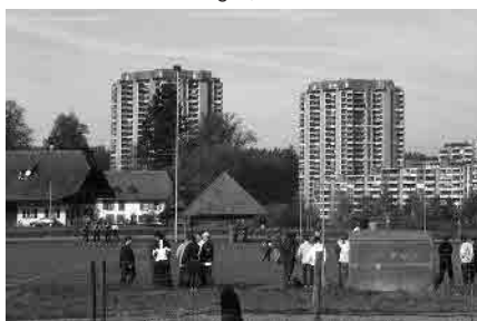
89 Landgut Brünnen und Holenacker