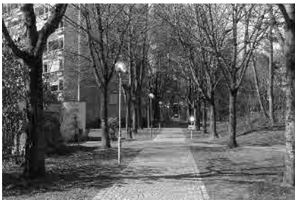
55 Allee zum Fellerstock