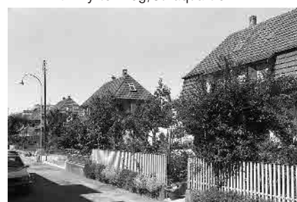
50 Werksiedlung Tobler, 1922