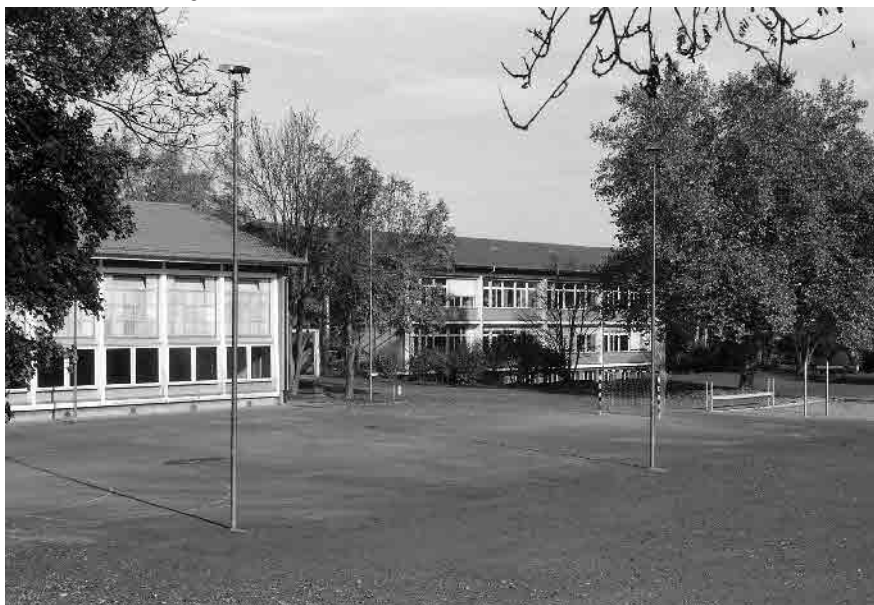
79 Schulhaus Stöckacker