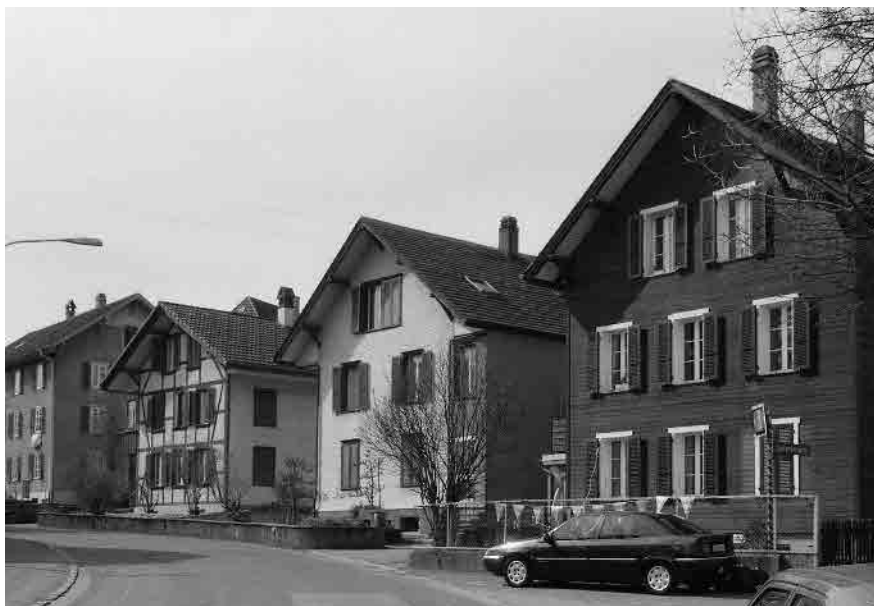
74 Stöckackerstrasse, Handwerkerhäuser