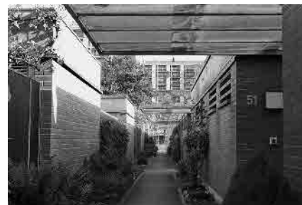
59 Atriumsiedlung Schwabgut