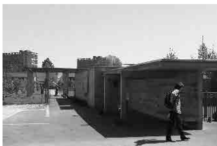
42 Friedhofeingang, 1994