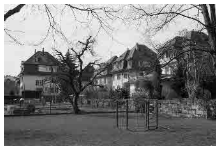
47 Lorbeerstrasse, Juraquartier