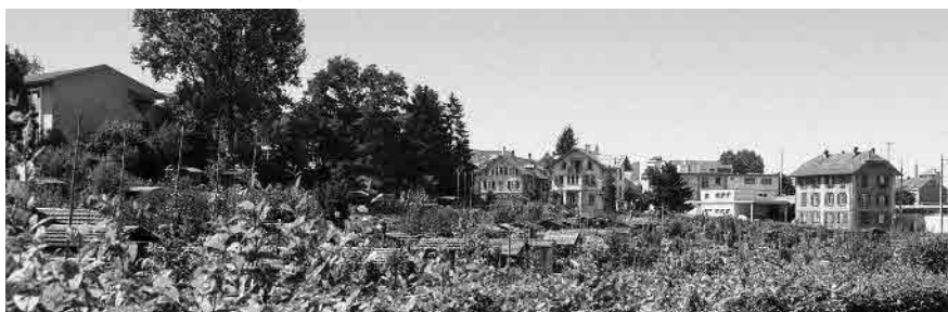
76 Schrebergärten Stöckacker