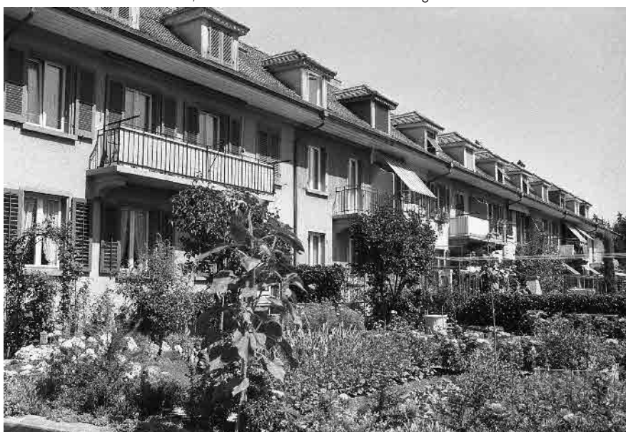
66 Wohnkolonie Innere Höhe, 1923–24