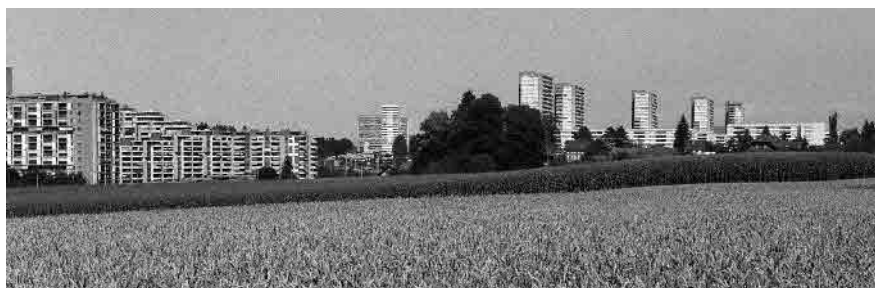
90 Gäbelbach, 1965–68, Holenacker, 1979–86 und Tscharnergut, 1958–66