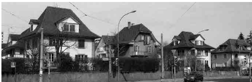
80 Älterer Ortsteil Bethlehem