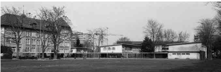
27 Schulhaus Höhe, 1903 und Erweiterungsbauten, 1957