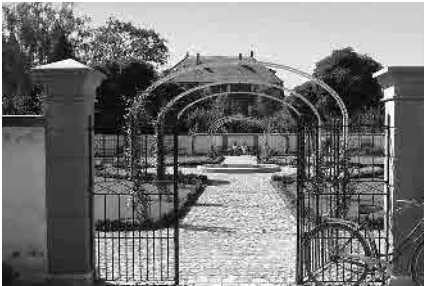
22 Barockgarten Neues Schloss