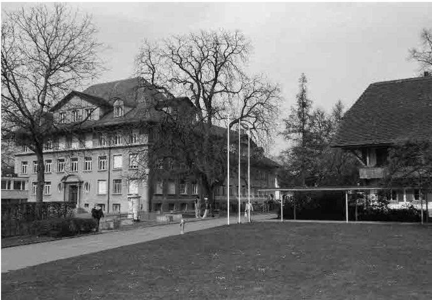
24 Schulhaus Statthaltergut, 1911