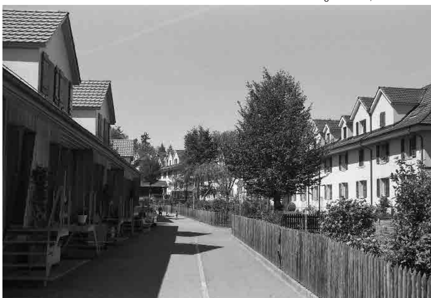
35 Wohnkolonie Brunnacker, 1920