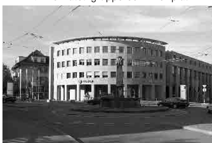
7 Zentrumsüberbauung, um 1990