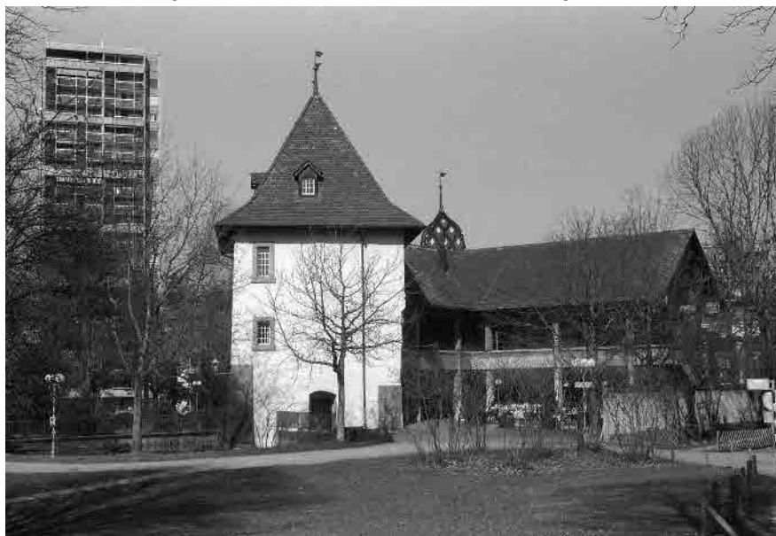
20 Altes Schloss, teilweise rekonstruiert