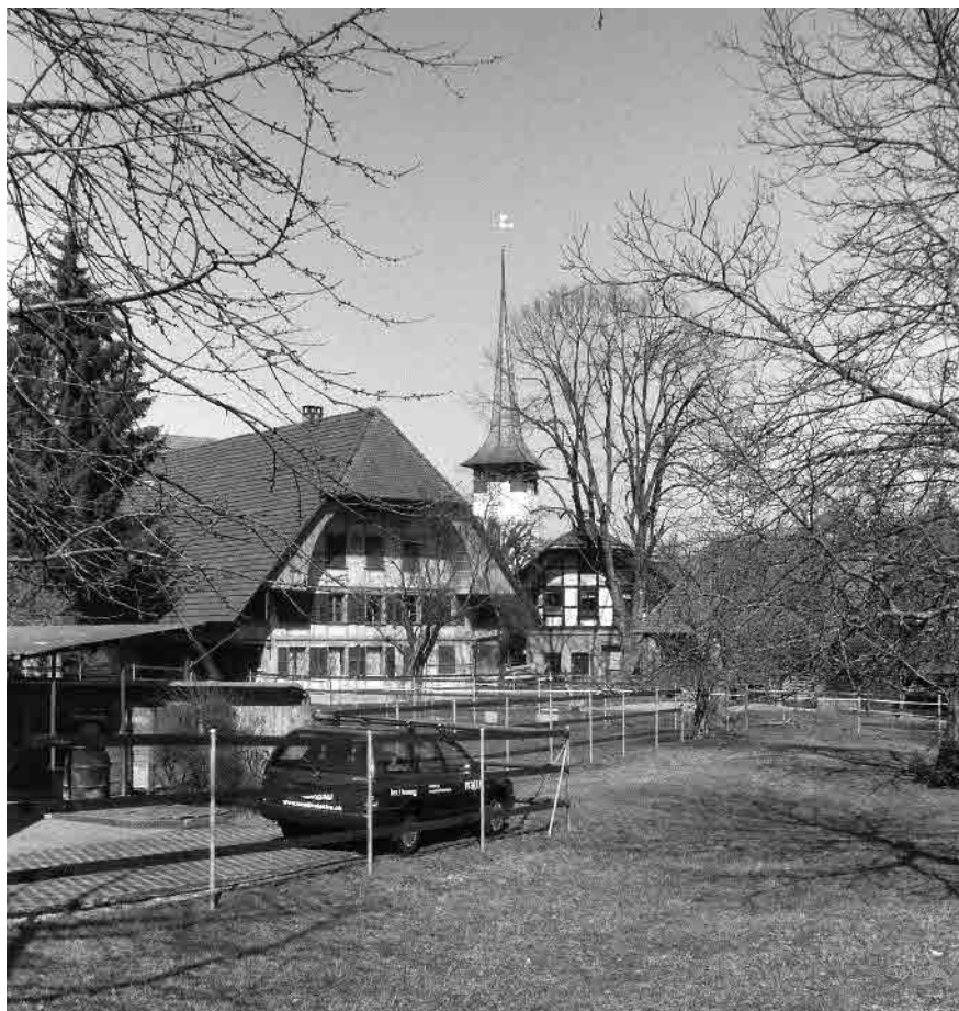
8 Bäuerlicher Dorfkern