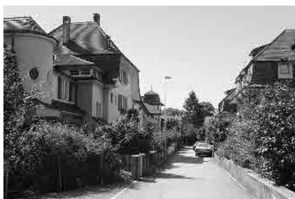
15 Peterweg, Villenviertel