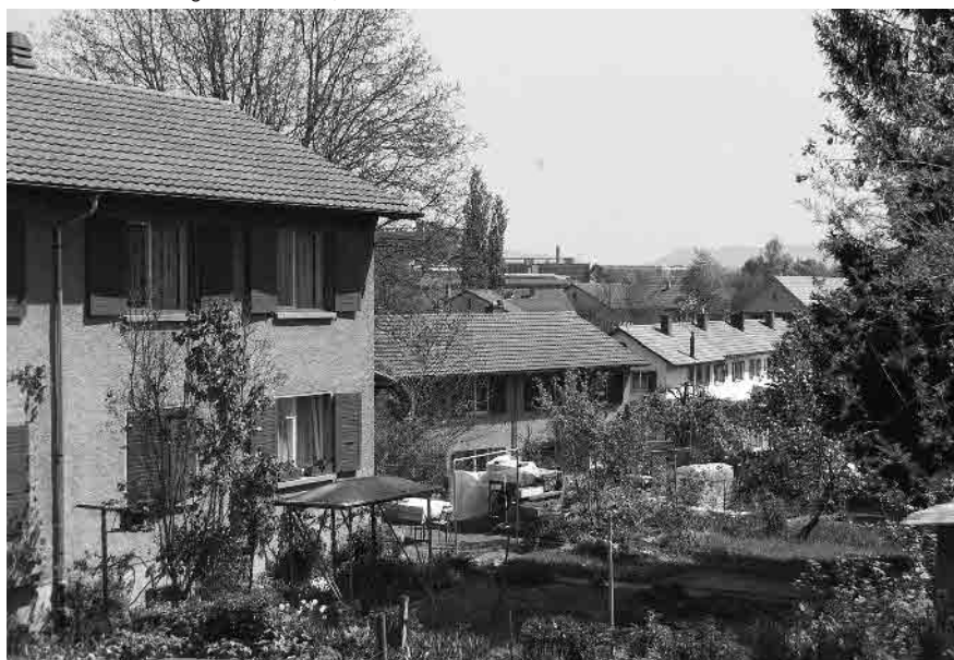
41 Siedlung Winterhalde