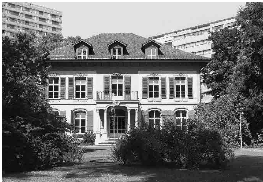
56 Fellerstock, um 1730