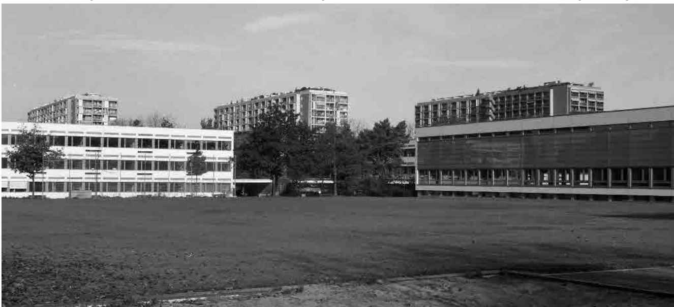
60 Schulhaus Schwabgut, 1961/1967