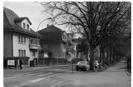
26 Bümplizstrasse, Bahnhofachse