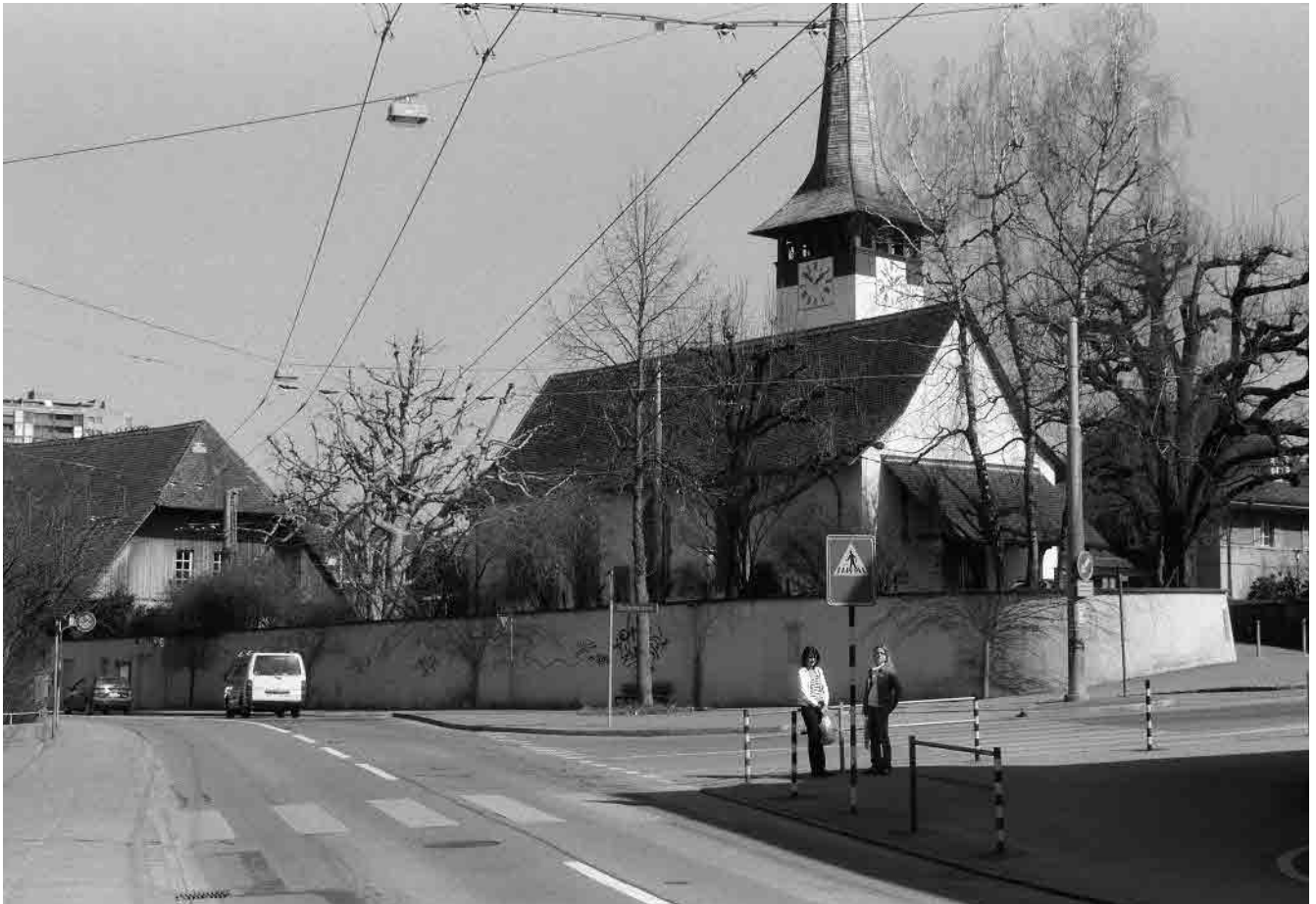
1 Kirchgruppe, 17.-19. Jh.