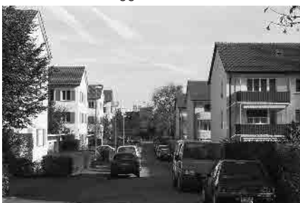
70 Siedlung Werkgasse, 1947–49