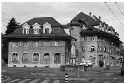
5 Überbauung Dorfplatz, 1908-14