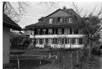
81 Wohnstock Bethlehemgut, 18. Jh.