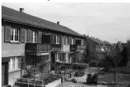
63 Bethlehemstrasse, 1945–46