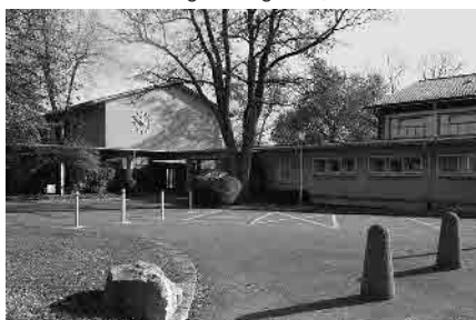
78 Schulhaus Stöckacker, 1955