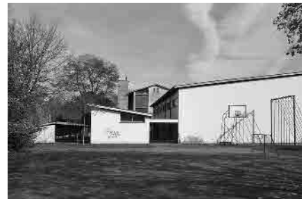
25 Turnhalle Statthaltergut, 1951