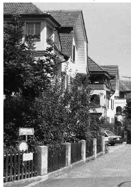
48 Myrtenweg, Juraquartier