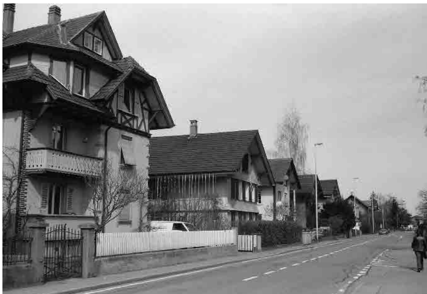
29 Freiburgstrasse, Handwerkerhäuser