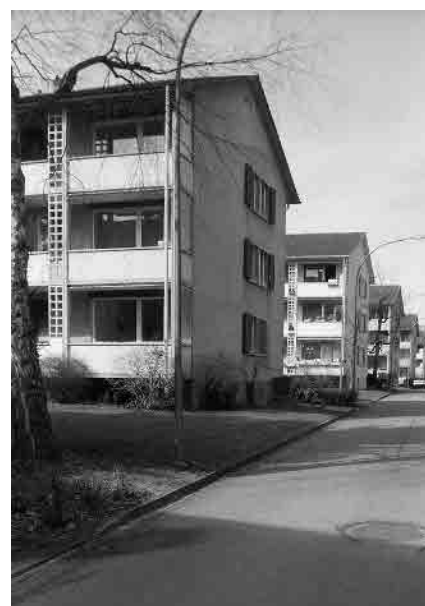
67 Siedlung Thüringstrasse, um 1950