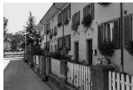
65 Wohnkolonie Innere Höhe