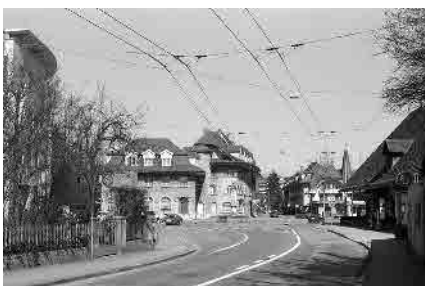
3 Bernstrasse, Dorfplatz