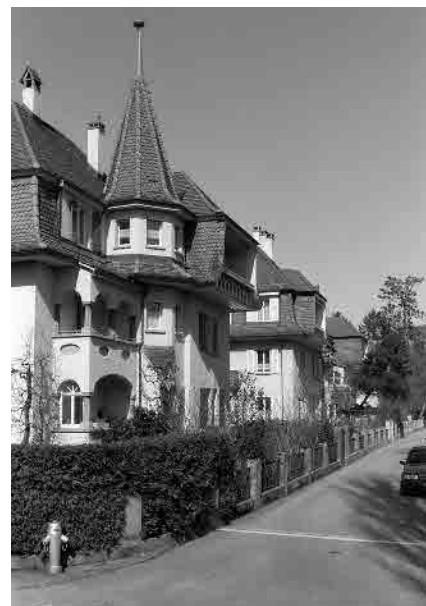
45 Lorbeerstrasse, Juraquartier