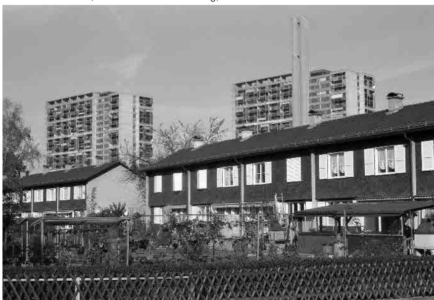
84 Bethlehemacker, Reihenhaussiedlung, 1944–47, und Grossüberbauung, 1967–74