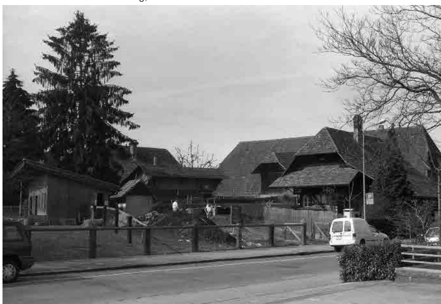
9 Bäuerlicher Dorfkern bei der Kirche