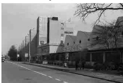
32 Werk Bodenweid