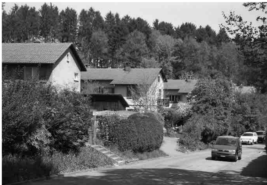
38 Siedlung Winterhalde, 1944-45