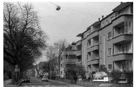
28 Bümplizstrasse, Bahnhofachse