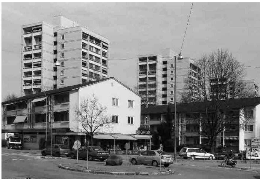
82 Neuhaus, differenzierte Überbauung, 1955–57