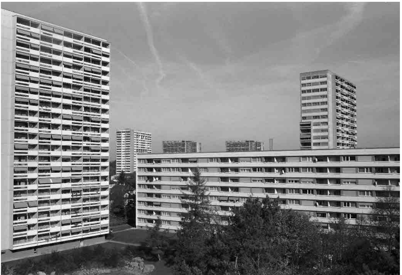
87 Tscharnergut, Grossüberbauung, 1958–66