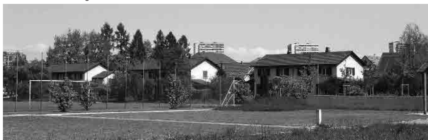
43 Innerer Grünraum und Doppelfamilienhäuser Stapfenackerstrasse