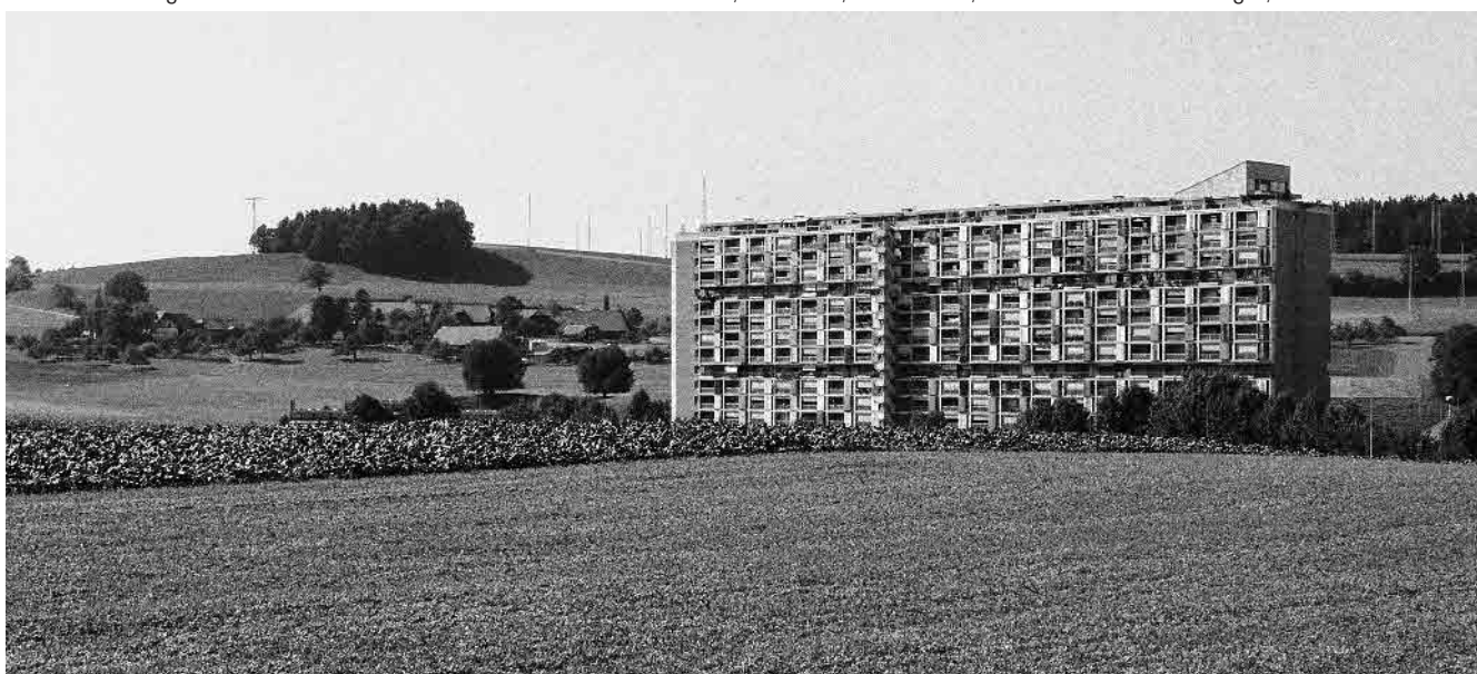
91 Gäbelbach, Grossüberbauung, 1965–68, im Hintergrund Weiler Riedern