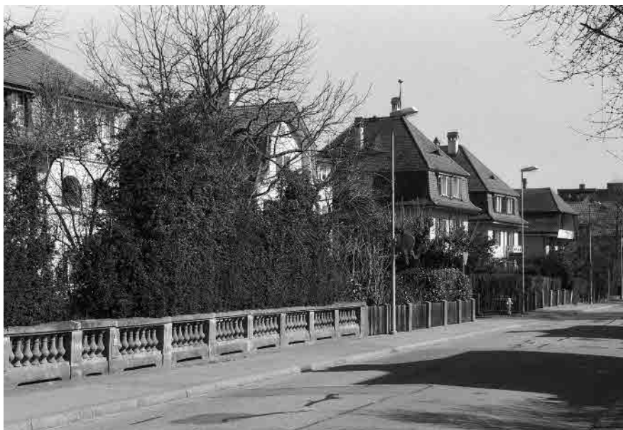
44 Brünnenstrasse, Juraquartier, 1905–1925