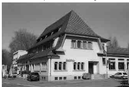
16 Druckereigebäude, 1905