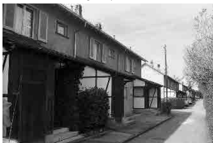
52 Siedlung Stapfenacker