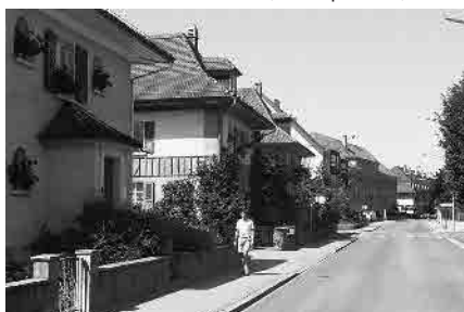
46 Brünnenstrasse, Juraquartier