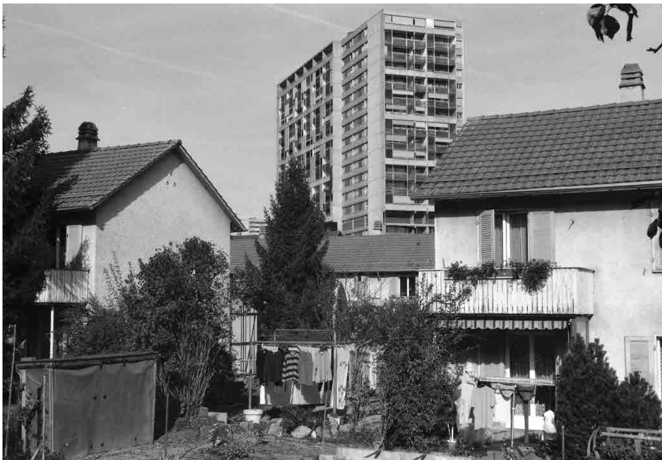
51 Siedlung Stapfenacker, 1942-44, und Hochhaus Fellergut, 1969-74