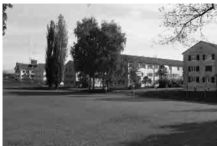
77 Siedlung Werkgasse, 1949