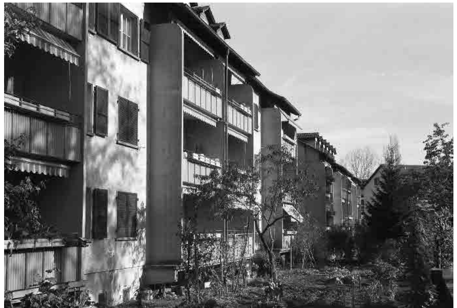
71 Kommunsiedlung Stöckacker, 1945–46