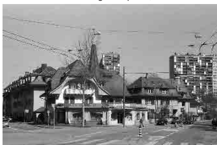
6 Heimatstilgruppe beim Dorfplatz