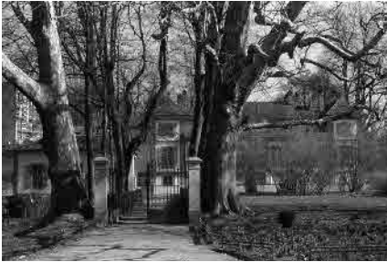
21 Portal Neues Schloss