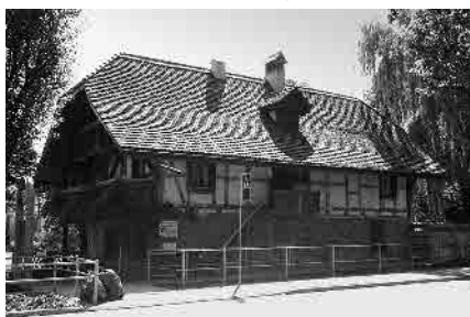
19 Stöckli, ehem. Schlossgut