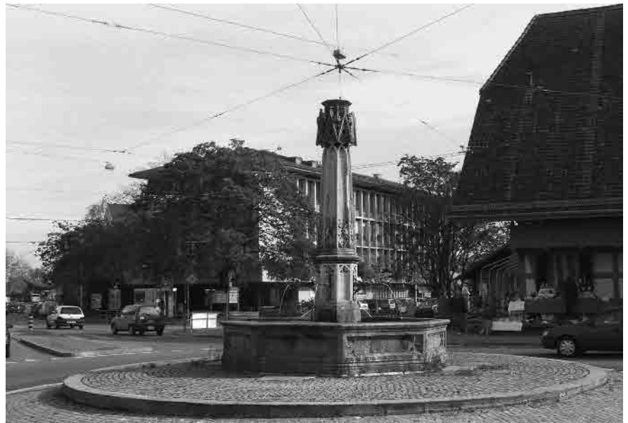
4 Dorfplatz mit ehem. Spitalgassbrunnen von 1846