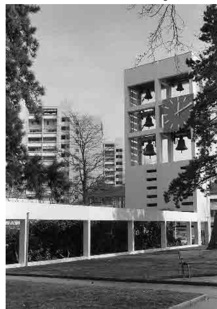
83 Ref. Kirche Bethlehem, 1960