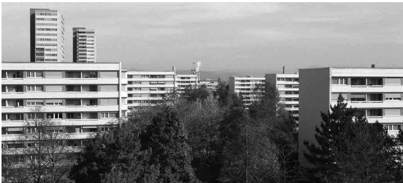
88 Tscharnergut, innere Grünachse