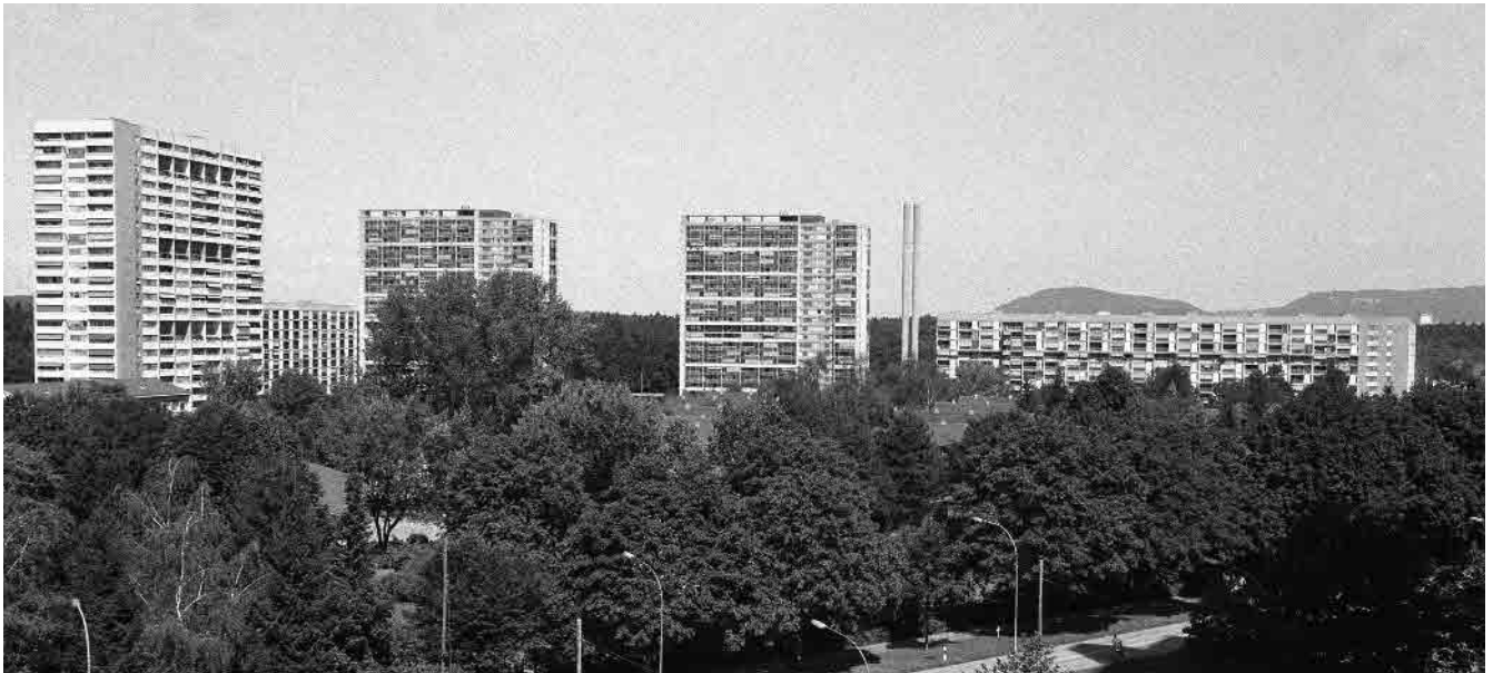
86 Bethlehemacker, Grossüberbauung, 1967–74