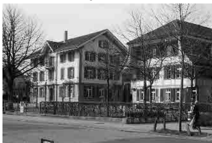
18 Alte Schulhäuser, 1835 und 1882