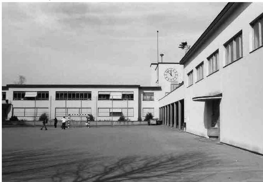
54 Schulhaus Stapfenacker 1932