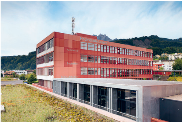
Campus des Departements Technik & Architektur in Horw.

Für die Erweiterung der Hochschule Technik und Architektur und die Zentralisierung der Pädagogischen Hochschule Luzern PHLU – wohl das grösste öffentliche Bauvorhaben seit Jahrzehnten und für Jahrzehnte in der Zentralschweiz – wurde im vergangenen Sommer ein Studienauftrag für vier bis fünf Generalplanerteams