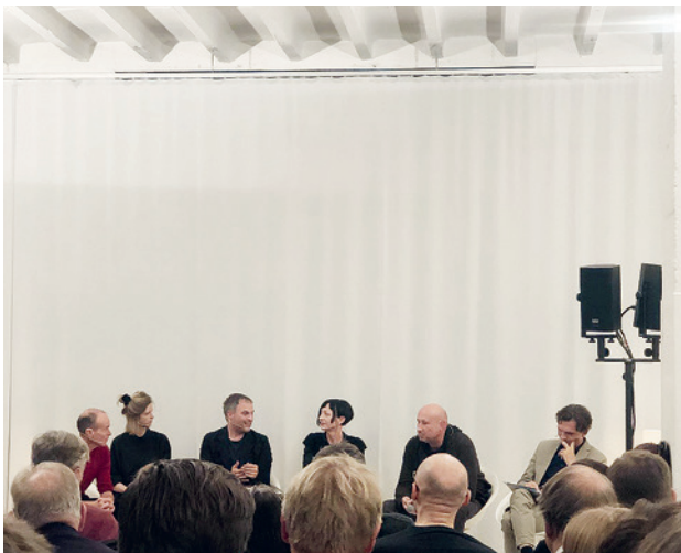
Debatte zur Norm 102: Gemeinsames Panel von BSA und SIA Zürich.

Wir stehen am Anfang einer Zeit des Umbruchs, langjährige Prämissen werden in naher Zukunft abrupt ändern. Die laufenden Verdichtungsdebatten haben das grosse Potenzial, Stadt und Landschaft als eigenständige Räume mit neuen Qualitäten zu sehen. Am Beispiel der « Räumlichen Entwicklungsperspektive Winterthur 2040 » debattierten wir laufende Testplanungen mit den Autoren und zustän-