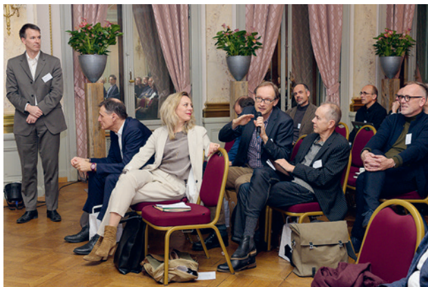
La Giornata FAS sulla partecipazione ha avuto una buona affluenza e ha stimolato accesi dibattiti.