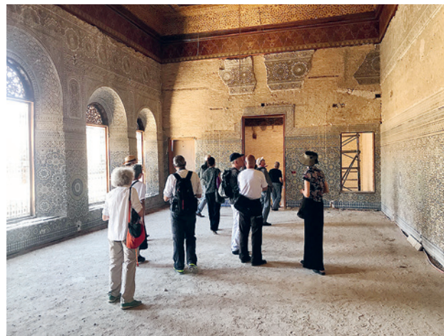
Der BSA Ostschweiz unterwegs in Marokko.