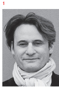
1 Neubau Atelierwohnungen, Wald ZH, Valentin Loewenberg, 2017, Valentin Loewenberg, Zürich