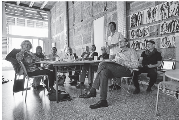
Workshop des Teams der «Nationalen Stelle für Baukultur und Städtebau».

Seit Jahren verfolgt der BSA Bern das Ziel, Architektur in der breiteren Öffentlichkeit sichtbar zu machen. Regelmässige Kolumnen in den Tageszeitungen Der Bund , Bieler Tagblatt und neu auch im Walliser Bote gehen dieser Frage nach. Ein zweites filmisches Zeitdokument (nach Franz Füeg – Widerstand und Neugier) zeigt den Menschen und das Werk von Alain G. Tschumi im Film «Construire