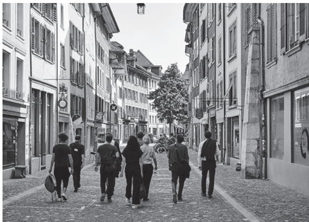
Gruppo di membri FAS nei vicoli della città vecchia di Bienne dopo l'assegnazione del premio FAS.