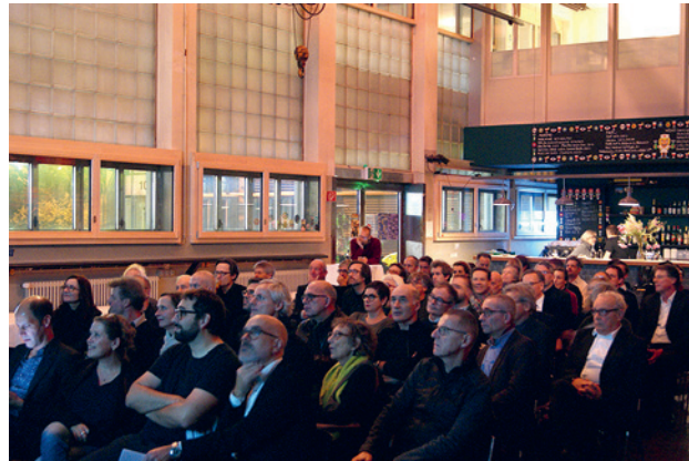
Hauptversammlung 2019 des BSA Basel im humbug