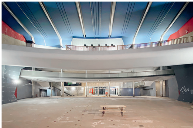
Le cinéma Plaza de Marc-Joseph Saugey est sauvé!

Ateliers de rencontres: Les ateliers de rencontre FAS Genève continuent à offrir des espaces de débat et de discussion riches,