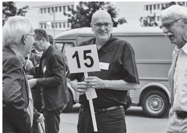
Al termine dell'Assemblea generale, i membri FAS del posto hanno mostrato ai colleghi la loro «Bienna privata».

Il premio FAS 2019 è stato assegnato al gruppo di società civile «Westast – so nicht!». La FAS onora il comitato «Westast – so nicht!» per il suo esemplare lavoro di milizia. Il riconoscimento conferma che gli architetti non sono soltanto degli specialisti della costruzione, ma anche dei cittadini consapevoli che mettono la loro competenza professionale al servizio della collettività. Il premio FAS di quest'anno