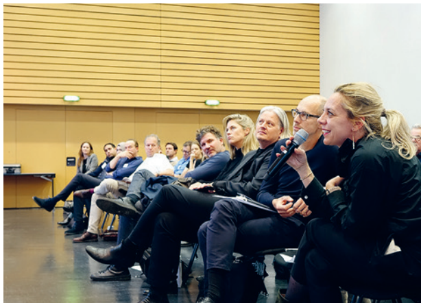
Alla Giornata FAS-CRB a Dübendorf sono state esplorate le possibilità di una cultura digitale del costruito.

Dopo oltre dieci anni, la FAS ha completamente rivisto il regolamento sulla borsa di ricerca. Nuova è soprattutto la cooperazione con