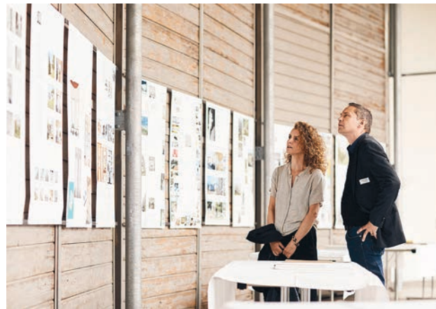
BSA Ostschweiz a présenté les portfolios des nouveaux membres à travers une exposition d'affiches à la Lokremise Saint-Gall.

Le 18 décembre 2017, le Conseiller fédéral Alain Berset (président de la Confédération suisse en 2018) inaugurerait lors d'une cérémonie officielle à Berne l'Année européenne du patrimoine culturel ( www.patrimoine2018.ch ). La FAS est membre de l'association de soutien et participe à l'Année du patrimoine 2018 par une exposition itinérante. Chacune des huit sections locales présentera un ouvrage qui lui tient à cœur sur deux affiches au format mondial avec des photos, des plans et des textes. La période historique retenue est le XX e siècle. La présentation s'adresse à un large public. Ces neuf affiches constituent ensemble une «famille» d'édifices qui méritent de l'attention, de la protection et de l'entretien.