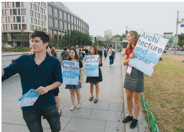
À Séoul un comité lausannois promouvait la candidature pour le congrès de l'UIA 2023.

L'UIA a été créée à Lausanne en 1948 avec la participation décisive de la Suisse. Elle représente les intérêts politiques et culturels de la profession au niveau mondial. En tant qu'organisation non gouvernementale (ONG) reconnue, elle est l'interlocuteur de la plupart des organisations de l'ONU, à savoir de l'UNESCO (Organisation des Nations Unies pour l'éducation, la science et la culture), de l'ONUDI (Organisation des Nations Unies pour le Développement Industriel), de l'UNCHS (United Nations Centre for Human Settlements, ONU-Habitat), de l'ESOSOC (Conseil économique et social des Nations Unies), de l'OMS (Organisation mondiale de la santé), et de l'OMC (Organisation mondiale du commerce). Regina Gonthier a été membre