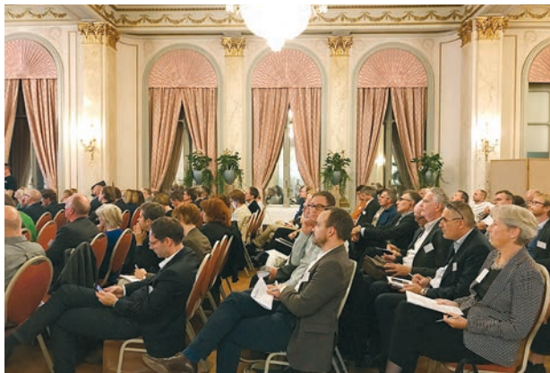
La journée des fonctionnaires en chef 2017 à Lucerne a été visitée par plus de 100 personnes intéressées de toute la Suisse.

A l'occasion de cette journée, la FAS a diffusé une publication de 80 pages sur le colloque de 2016 («Le XX e siècle classé monument